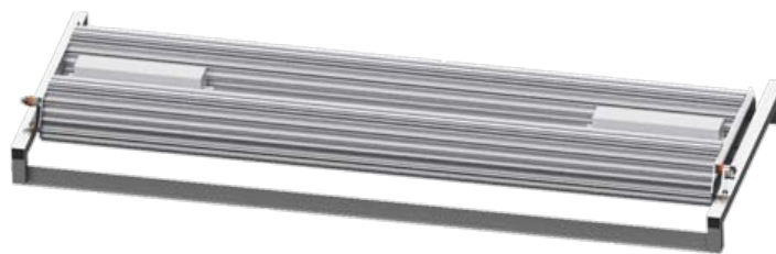
Conjunto Linear Defletor Duplo 2.000

Somente após a montagem a película azul protetora é removida, para preservar o elevado brilho e alta reflexão, sem riscos.