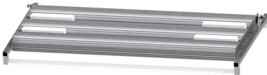
Conjunto Linear Defletor Triplo 2.000 mm x 420 mm

As Estações são compostas de dois Conjuntos Linear Duplos ou Triplos em Linha como no primeiro gráfico acima na página precedente.